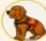
PERRO DE RESCATE